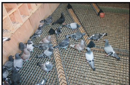
Inne i ungdomslaget.

Det var 107 duer igjen når finalen skulle gå, av disse kom 81 hjem. De norske duene gjorde det også her meget bra: